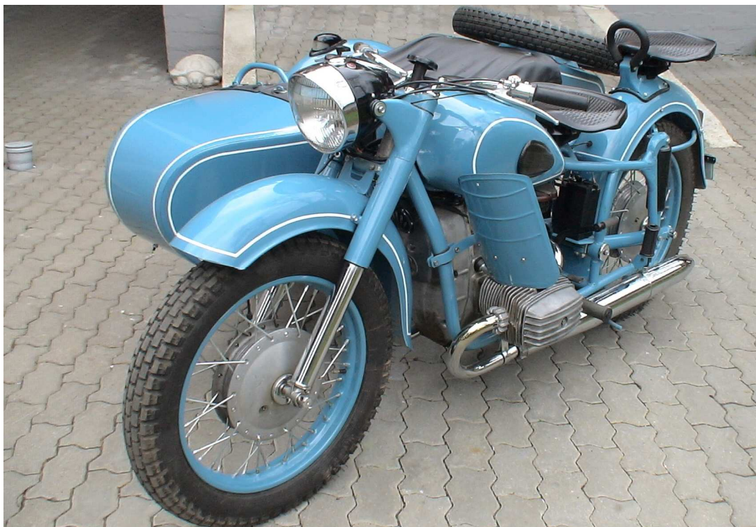
Diagonaalvaade esiosale ja vasakule küljele