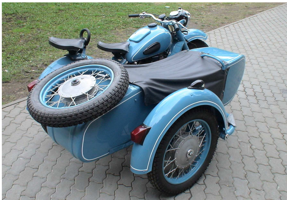
Diagonaalvaade tagaosale ja paremale küljele