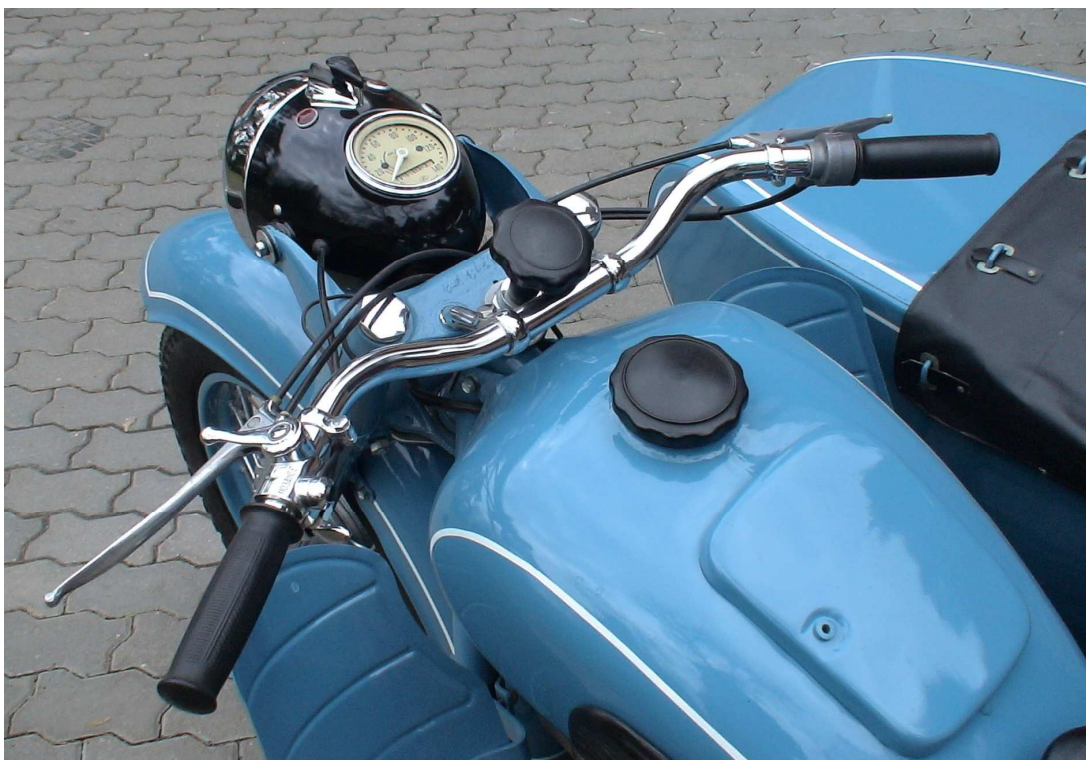
Vaade sõiduki juhtimisseadmetele