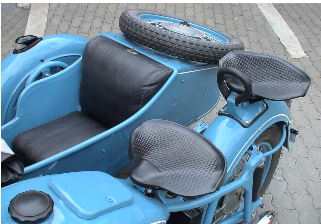
Vaade sõiduki istme(te)le